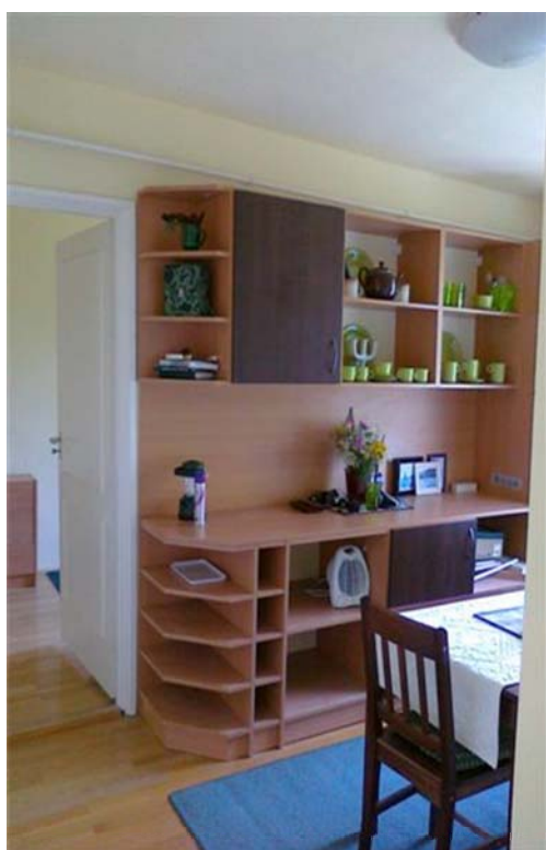
Nappali szintű társalgó-étkező