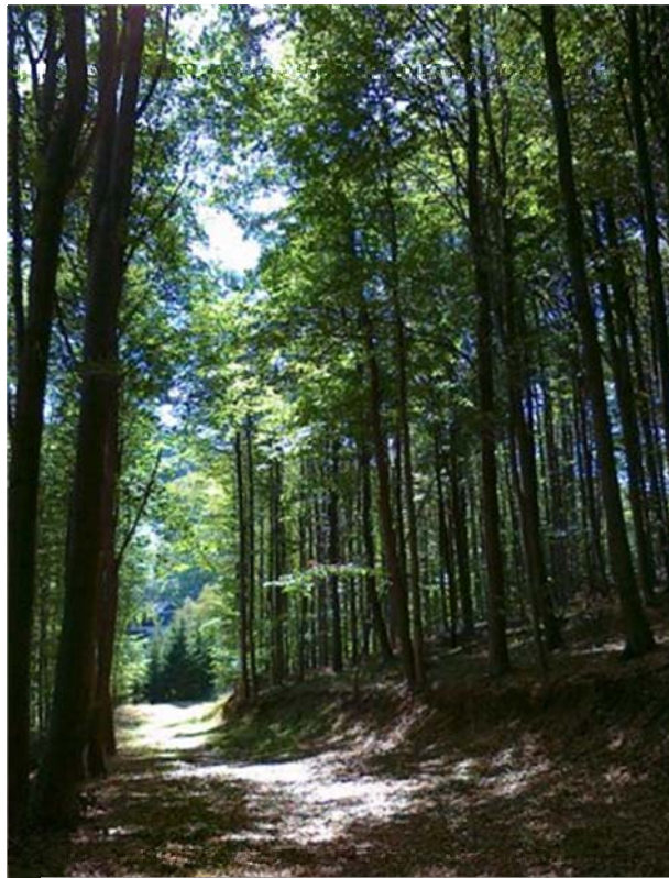
Sétaút a Vendégház közelében