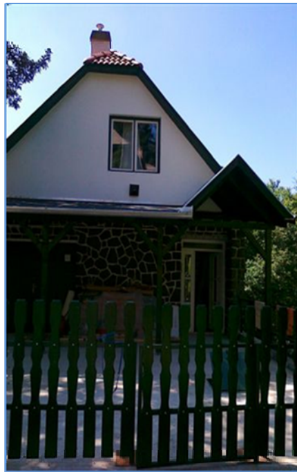
A Vendégház nyáron