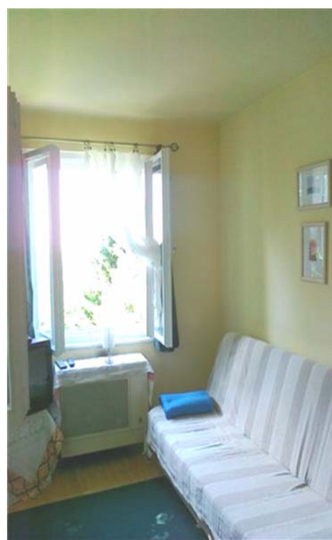
Nappali szintű háló