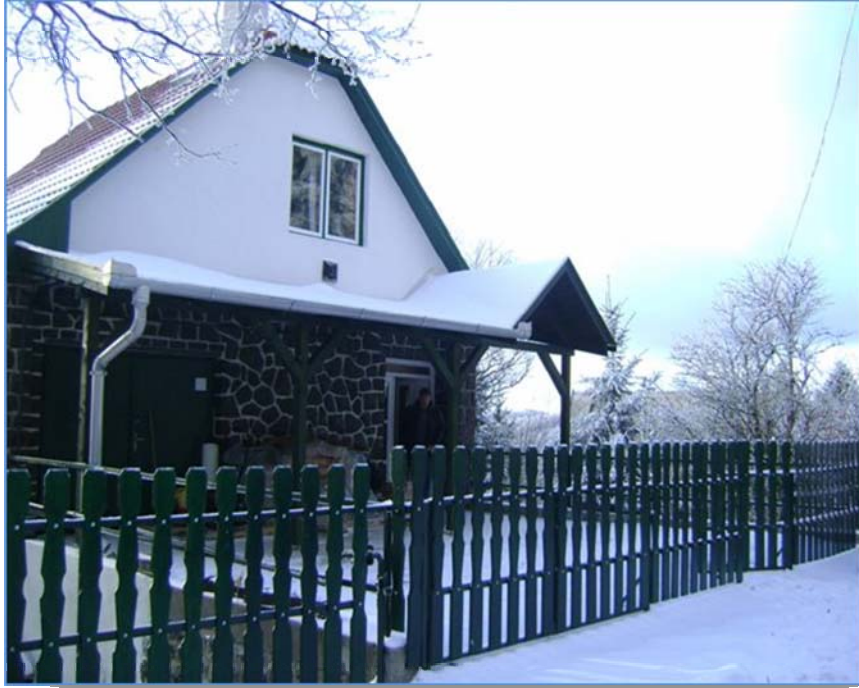
A Vendégház télen