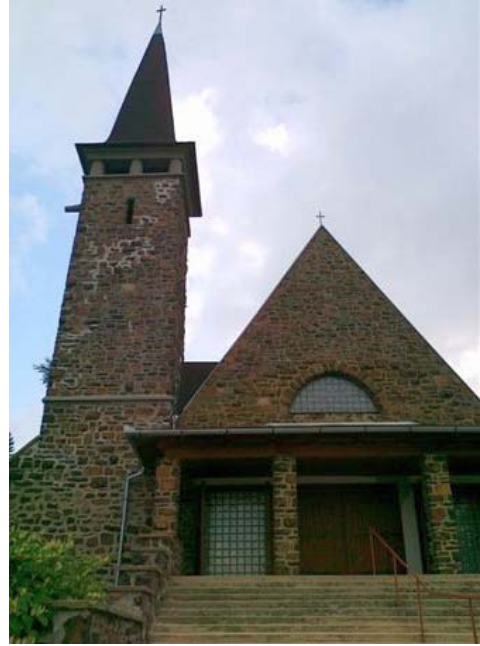
A Magyarok Nagyasszonya templom