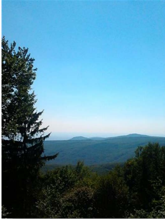
Kilátás a nappali szintről