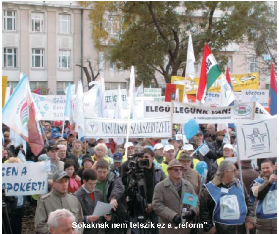
Sokaknak nem tetszik ez a „reform”

Megfogalmazták: nem vagyunk vakok! Nagyon jól tudjuk, hogy a jelenlegi egészségbiztosítási rendszer nem tartható