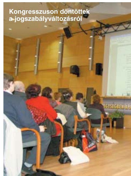
Kongresszuson döntöttek a jogszabályváltozásról