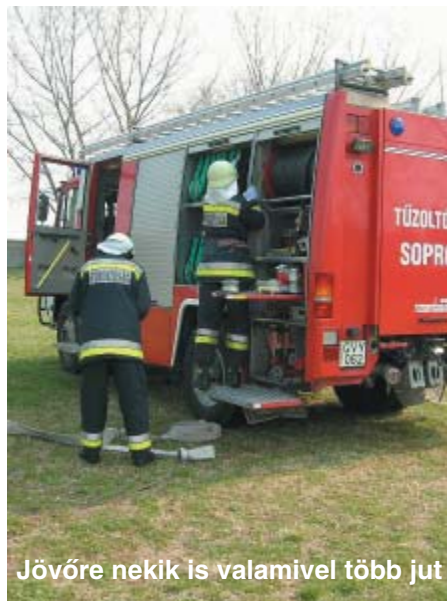
Jövőre nekik is valamivel több jut

F, G és H kategóriában – pedig az alatti növekedés lesz. Mindez az adójóváírás egységesítésének és szélesítésének a nettó illetményeket differenciáló hatása miatt alakul így, a felek ugyanis ennek ésszerű kiegyenlítésére törekedtek. A megállapodás rögzíti, hogy a legalacsonyabb kategóriában kapható fizetés érje