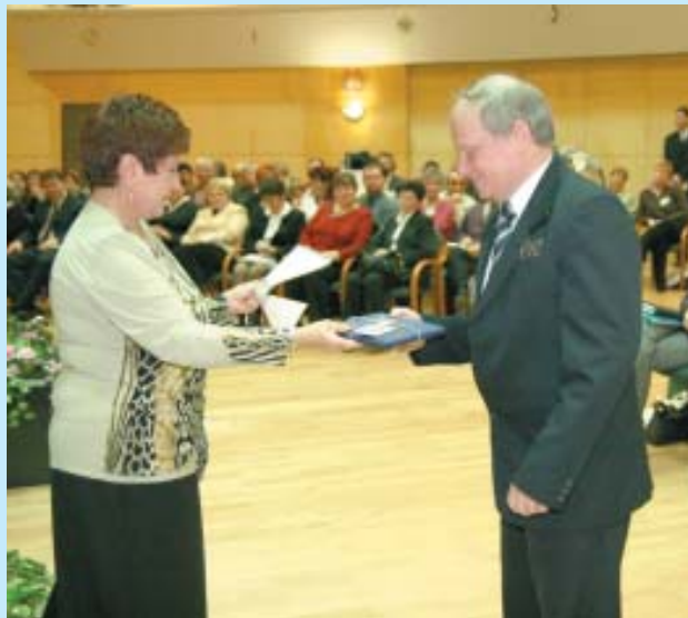
A főtitkár a kerek évfordulókat is köszöntötte