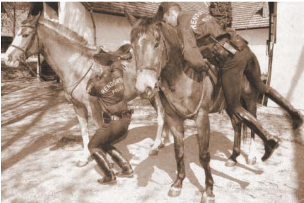
Archív képünk tanúsítja, hogy egykoron színvonalas munka folyt a közeli lovasakadémián

A helybeliek azóta is a régi dicsőségeket idézik. Nem tudnak belenyugodni, nem hiszik el, hogy lezárult volna a sárdi lótenyésztés 250 éves korszaka. Az innen kikerülő lovak a legutóbbi időkig hazai és nemzetközi versenyeken, és a rendőrségi igények kielégítésében szép eredményeket értek el. Talán az sem véletlen, hogy amikor a felszámolásának híre ment, felbukkantak az érdeklődők között az olasz lovasszövetség szakemberei is. (DL)