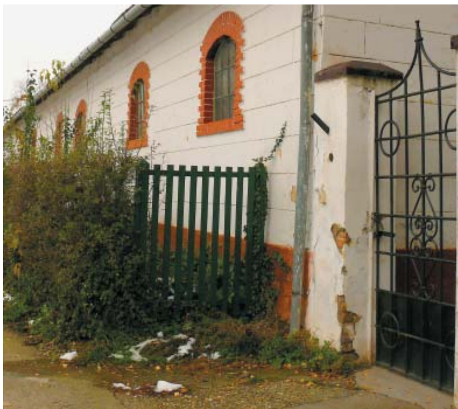
A Somssich-birtokból megmaradt eredeti istálló épülete. A lóállások fölött a néhai híres lakók nevei is fennmaradtak

gítését. Sőt, szolgálati lakásának kényeszerű elhagyásáért is adnak neki valamit.