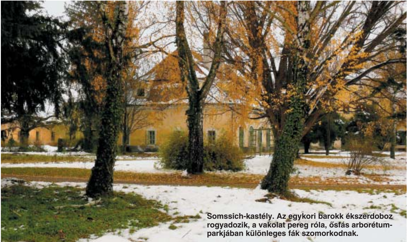
Somssich-kastély. Az egykori barokk ékszérdoboz rogyadozik, a vakolat pereg róla, ősfás arborétum-parkjában különleges fák szomorkodnak.